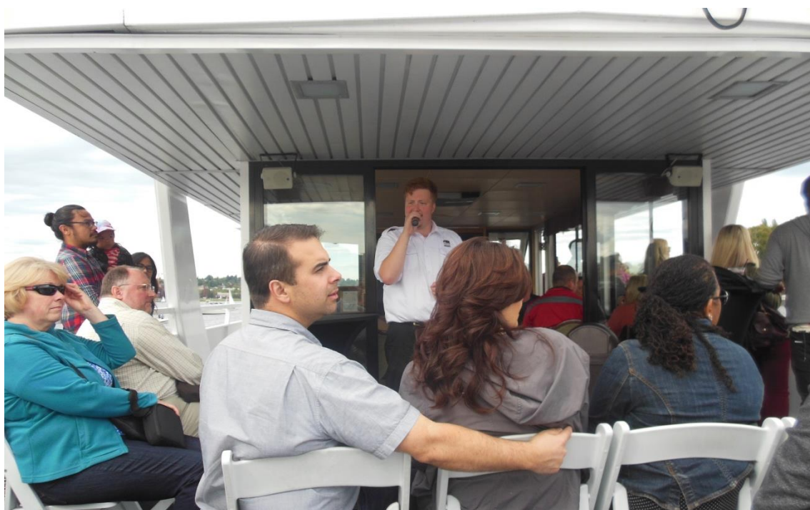
クルージングには必須?! ガイドのお兄さん。

本資料は大阪市立大学商学部宮川研究室におけるゼミ用教材を目的に作成したものです。本資料には事実ではなく仮説として設定された内容も含まれています。これ以外の目的で使用することは固くお断りします。