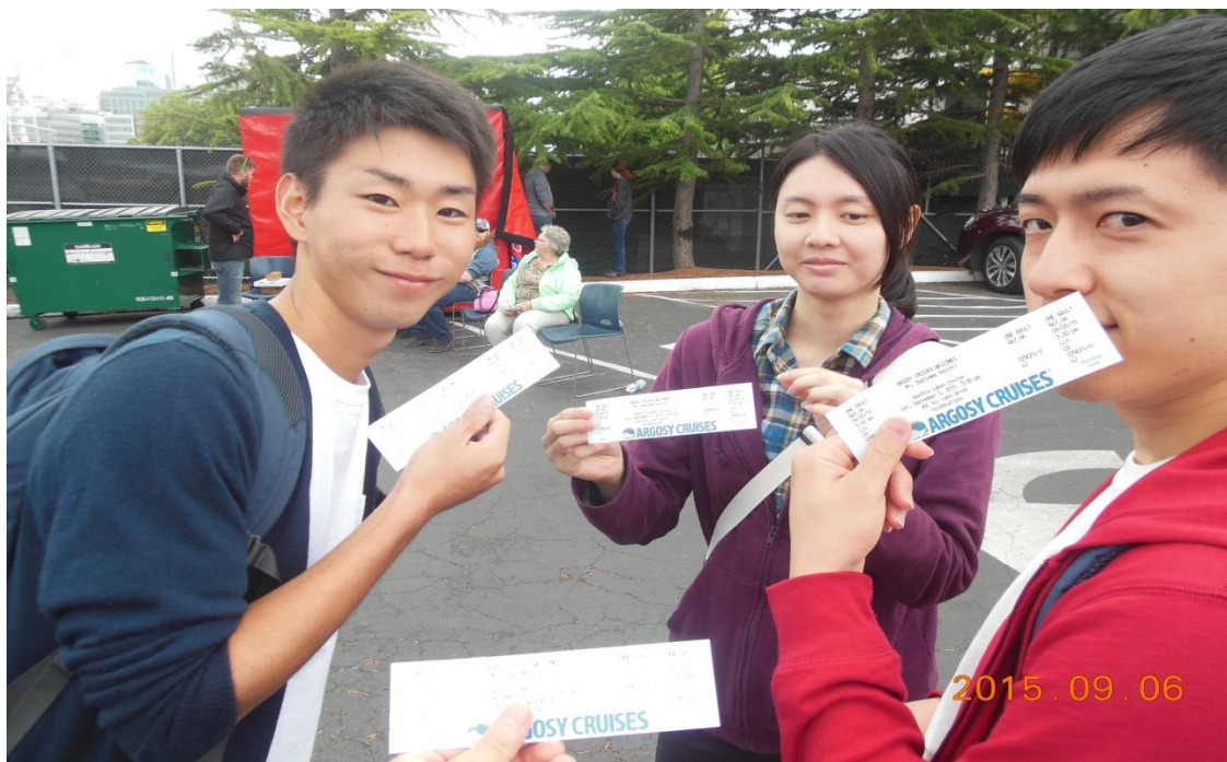
いざクルージングへ！

本資料は大阪市立大学商学部宮川研究室におけるゼミ用教材を目的に作成したものです。本資料には事実ではなく仮説として設定された内容も含まれています。これ以外の目的で使用することは固くお断りします。