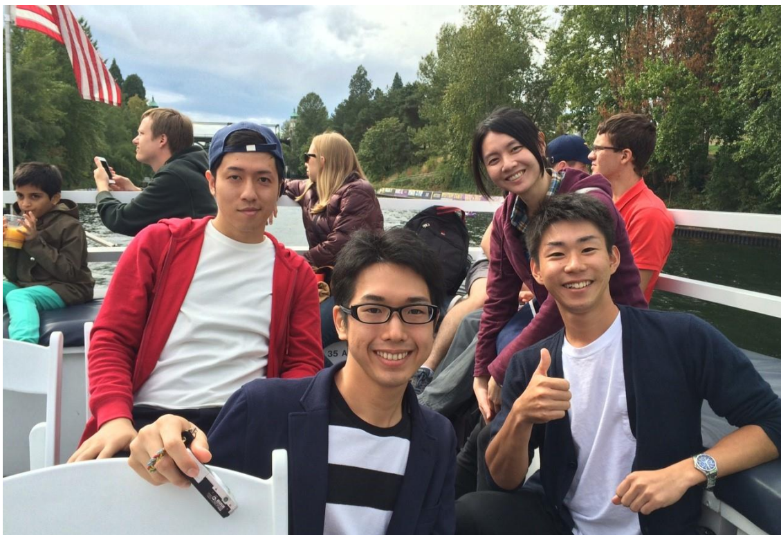
船上での一枚。サイドの席、めっちゃ羨ましかった！