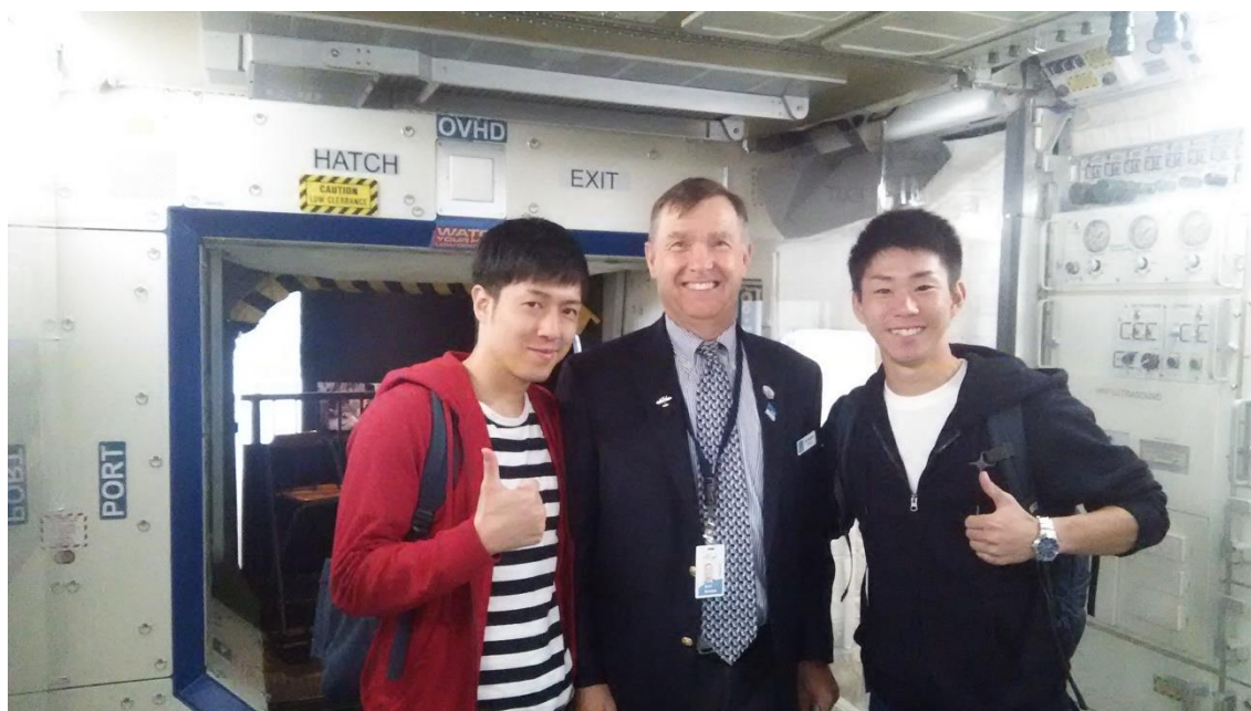
色々と説明をして教えてくれたおじさんとの一枚。