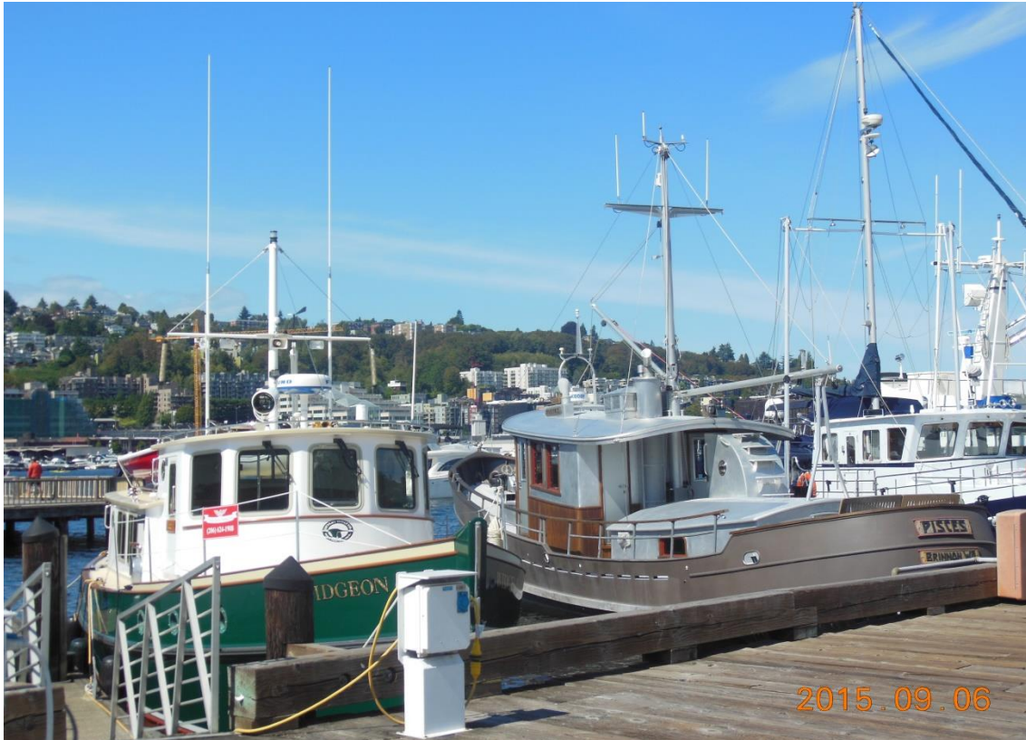
値段もすごいがとってもカッコいい船の数々。