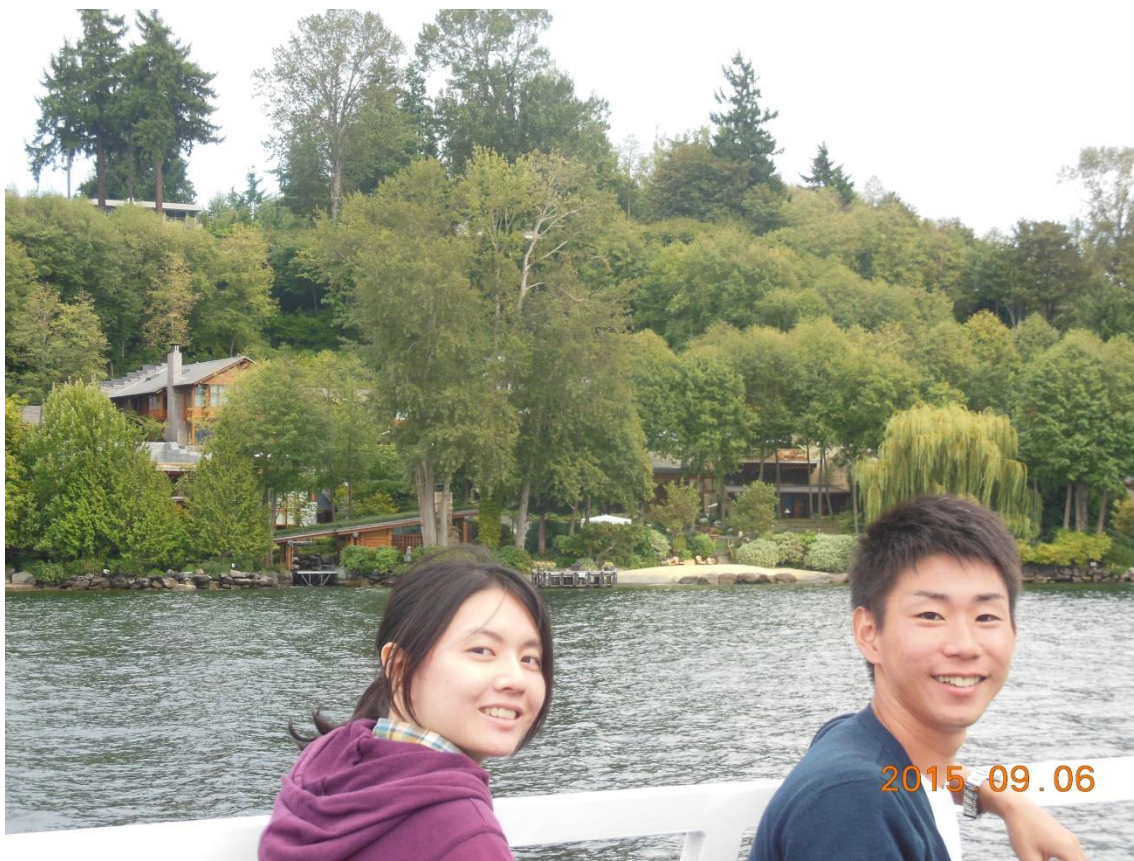
これでもまだまだ一部分の豪邸をバックに。