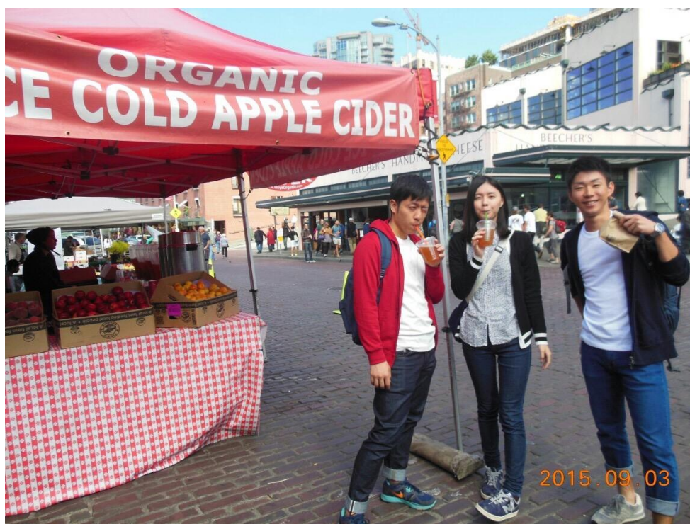
ドーナツを食べて喉が渴いたのでアップルサイダーを購入。今思い返せば結構いいお値段でした。