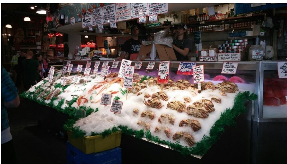
新鮮な果物に野菜、そして海の幸！