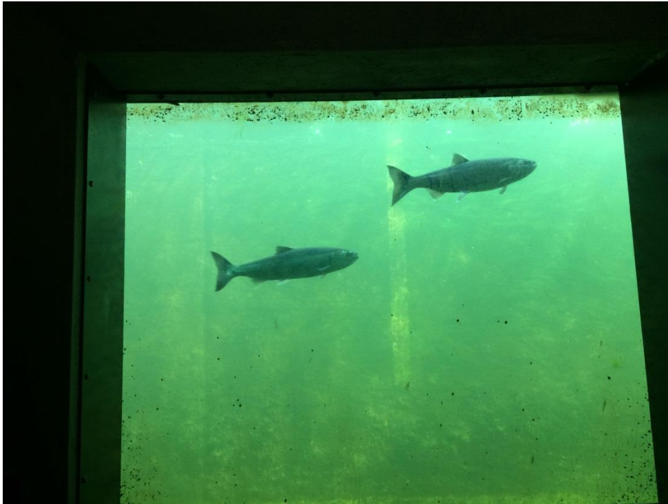
ガラス越しに 21 段ものフィッシュラダーを上る魚を見学。