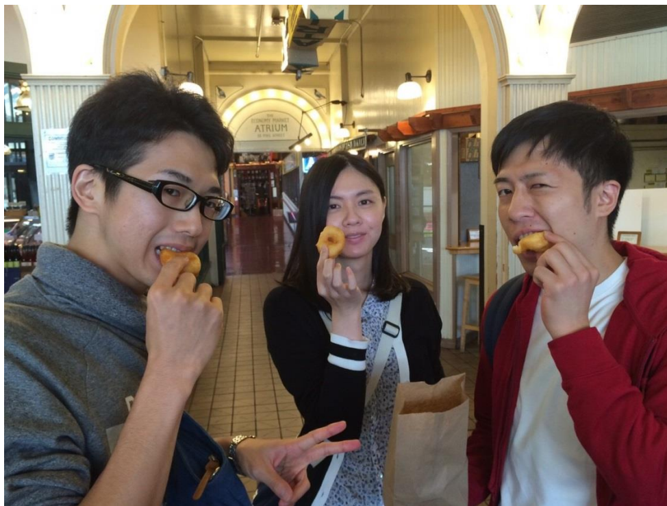
ガイドブックに載っていたドーナツ屋さんでおやつタイム。