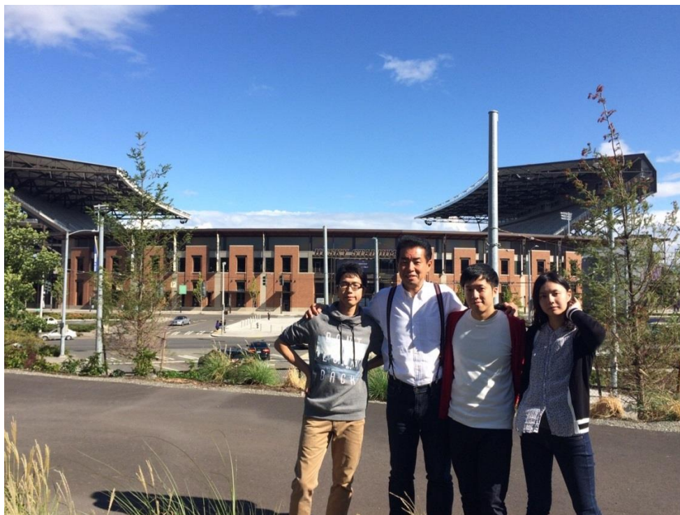
大きなハスキースタジアムも外観だけ見に行きました。