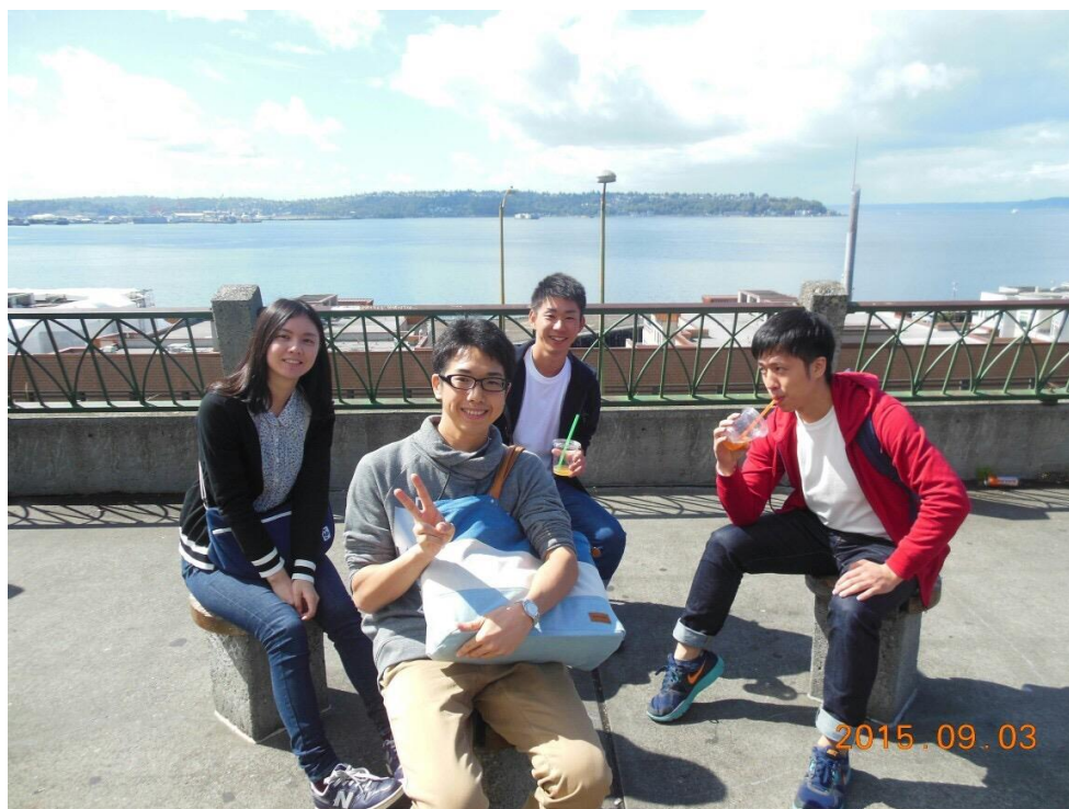
マーケットを抜けると海が見える広場がありました。