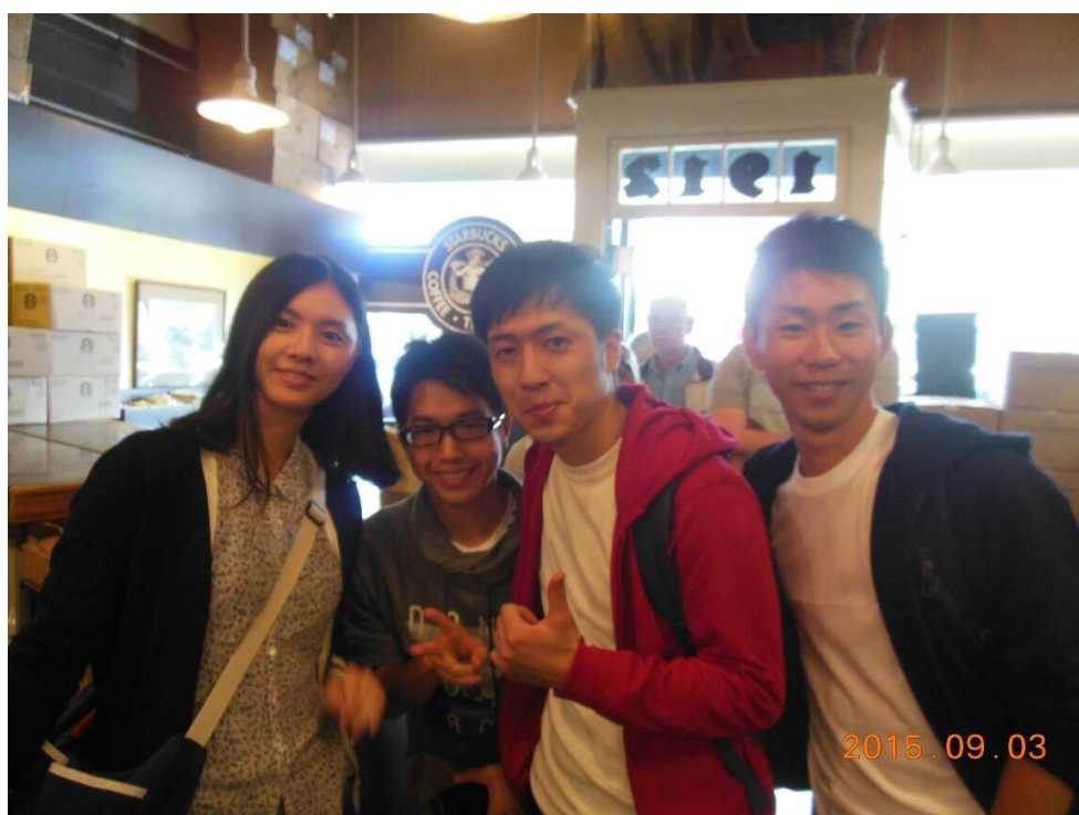
スタバ1号店の味、パイクプレイス・ローストを堪能。何と今その味を再現したものが日本のコンビニなどで買えるそうです。