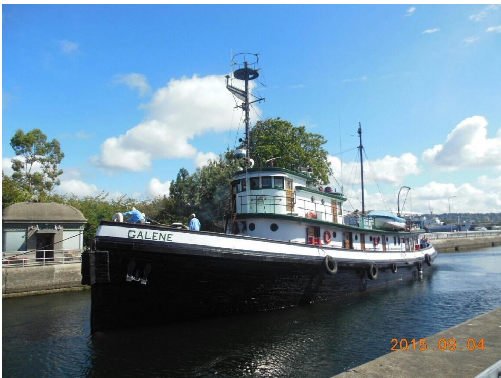
どの船もバーベキュー用のグリルを積んでいました。